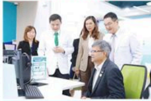
นายไมล์เฮลด์ อับดุล ฮาซิม ได้เยี่ยมชมการแพทย์ทางไกลของโรงพยาบาลศิริราช

ในช่วงหลายปีที่ผ่านมาประเทศไทยและบังกลาเทศได้มีสัมพันธไมตรีที่แน่นแฟ้น โดยเฉพาะอย่างยิ่งในด้านเศรษฐกิจ การค้า การศึกษา การท่องเที่ยว การลงทุน และการพัฒนาที่ยั่งยืน