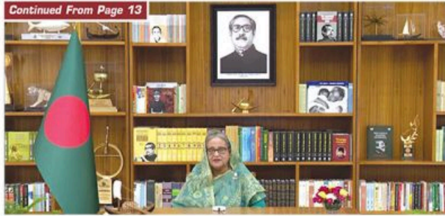
นายกรัฐมนตรีบังกลาเทศ ชิด ฮาซินา กล่าวขอบคุณในการประชุมระดับสูงเพื่อลดผลกระทบของโควิด-19 ของประชาชาติ (ESCAP) ที่กรุงพนมเปญ เมื่อวันที่ ๑๔ พฤษภาคม ๒๕๖๖