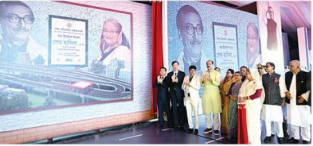
ชิด ฮาซินา ในพิธีเปิดทางด่วนยกระดับธากา เมื่อวันที่ ๒ กันยายน ๒๕๖๖

ทางด่วนยกระดับธากา: บทพิสูจน์ความสำเร็จของไทย บมจ. ธิดาเสียดไทย ดีเวลลอปเม้นท์ (ITD) ซึ่งเป็นบริษัทก่อสร้างชั้นนำของไทย เป็นหุ้นส่วนเอกชนรายสำคัญในการทางด่วนธากา ITD ถือหุ้นใหญ่ (51%) ในโครงการความร่วมมือระหว่างภาครัฐและเอกชน (PPP) ผ่านทางบริษัทย่อยอย่าง First Dhaka Elevated Expressway Company Limited ซึ่งแสดงให้เห็นถึงความเชื่อมั่นและความสามารถของประเทศไทยในโครงการเมือง กรณีมีส่วนร่วมของ ITD ได้เร่งการก่อสร้างทางด่วน ให้ประชิดจากประสบการณ์และความเชี่ยวชาญที่สั่งสมมาในการพัฒนาโครงสร้างพื้นฐาน บทบาทของ ITD ในฐานะผู้รับผิดชอบแบบ EPC คือ การสำรวจออกแบบก่อสร้างศิลปะระหว่าง 19.73 กม. ทางขาด 27 กม. ประตูนับพันคันทาง 8 แห่ง และอาคารควบคุมทาง 1 แห่ง และดำเนินการก่อสร้างของงวดแรก