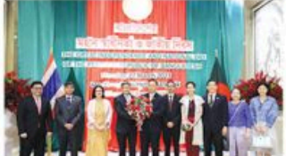
প্রধানমন্ত্রীর কার্যালয়ে বাংলাদেশি কর্মকর্তাদের পদোন্নতি লাভের শুভকামনা প্রকাশ করেছেন।

বাংলাদেশি কর্মকর্তাদের পদোন্নতি লাভ করেছেন। বাংলাদেশ সরকারের পক্ষ থেকে বাংলাদেশি কর্মকর্তাদের বাংলাদেশি কর্মকর্তাদের পদোন্নতি লাভ করেছেন।