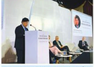
বাংলাদেশি কর্মকর্তাদের পদোন্নতি লাভ করেছেন। বাংলাদেশ সরকারের পক্ষ থেকে বাংলাদেশি কর্মকর্তাদের বাংলাদেশি কর্মকর্তাদের পদোন্নতি লাভ করেছেন।