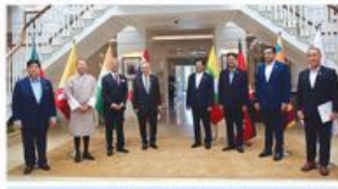
প্রধানমন্ত্রীর কার্যালয়ে বাংলাদেশি কর্মকর্তাদের পদোন্নতি লাভের শুভকামনা প্রকাশ করেছেন।